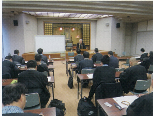
8月 若手僧侶のための "御同朋" 学習プログラム