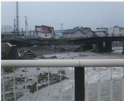
9月 十勝被災地視察

発行所 札幌市中央区北3条西19丁目 (郵便番号 060-0003) 北海道教区教務所 電話 011-611-9623 編集 北海道教区教務所 発行人 黒田 正 宣