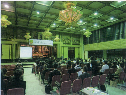
6月 思春期・若者を知るための 公開シンポジウム