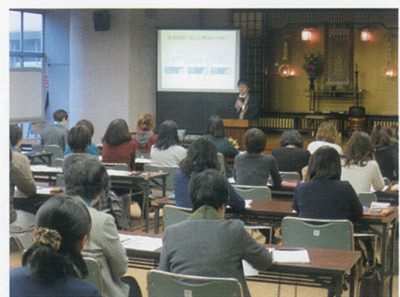
12月 若婦・若寺婦合同研修会