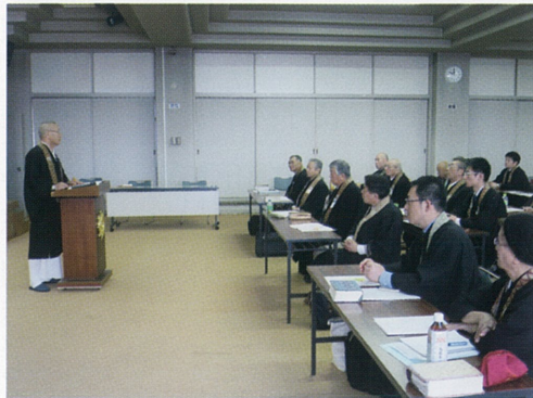
5月 連区布教使研修会