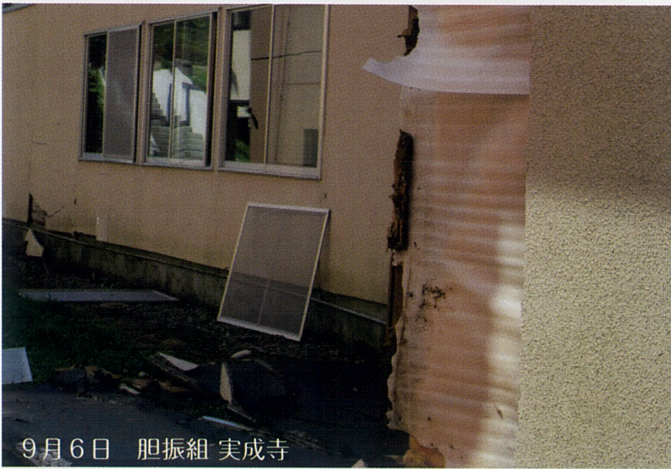
9月6日 胆振組 実成寺