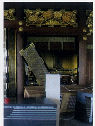
9月6日 胆振組 法城寺

9月6日に発生した「北海道胆振東部地震」より4ヶ月が経ちました。前日の台風21号による被害と、地震の発生に伴う北海道全域でのブラックアウト、余震も続く中で長い間不安な日々を過ごしました。被災された各ご寺院のご住職やご門徒の方々は、復興に向けて少しずつあゆみを進めておられますが、まだまだほど遠い現状です。 今年の漢字は「災」でしたが、日本各地で多くの自然災害が発生したということだけでなく、それによる自助共助を重視する方が増え、防災や減災意識の高まりも理由の一つだそうです。 北海道教区にてお願いしております義援金には、全国各地より多くのご協力をいただいておりますこと、厚く御礼申し上げます。有難うございました。