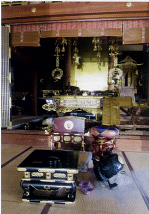
9月6日 胆振組 浄願寺

発行所 札幌市中央区北3条西19丁目 (郵便番号 060-0003) 北海道教区教務所 電話 011-611-9623 編集 北海道教区教務所 発行人 中尾了信