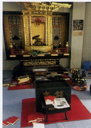
9月11日 札幌組 如来寺