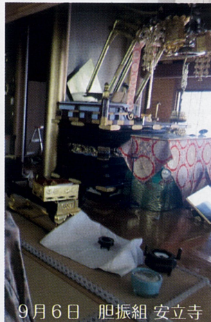
9月6日 胆振組 安立寺