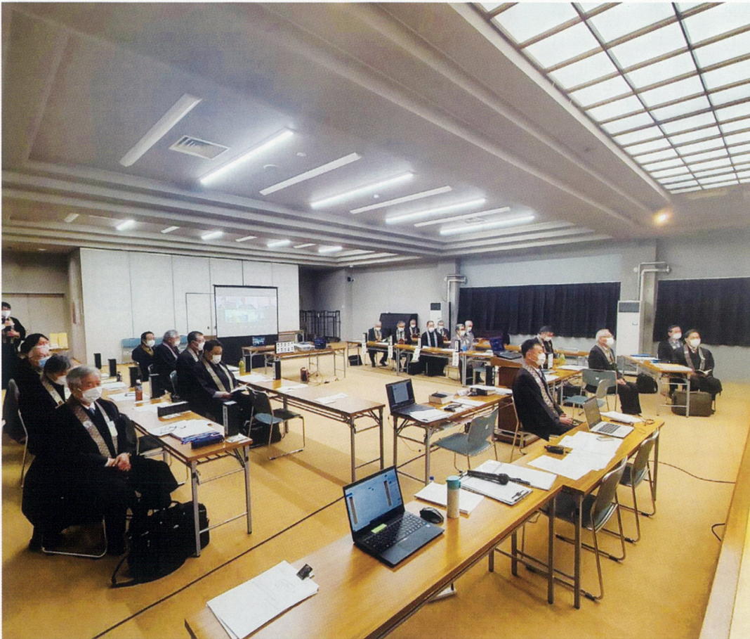
〈写真は第22回定期教区会〉